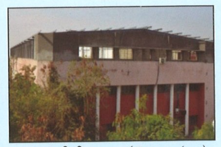
यु.आय.सी.टी. इमारत (Extension)