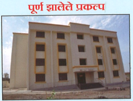
अनुसूचित जमाती (मुलींचे) वसतिगृह