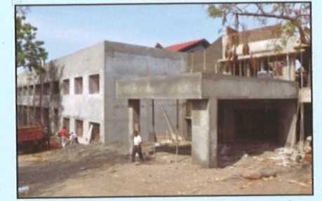
जीवशास्त्र प्रशाळा इमारत (दुसरा टप्पा)